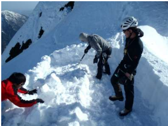
【 BPの整地 16:25 】

ここで、すぐ後から来たソロの人にロープを貸す。今日は間天の科尔までは行こうと思っていたが意外と時間がかかってしまい届かず。明日の朝、雪が締まっている間にサクサク行こうと決めて、間ノ岳手前の科尔でビバークすることにした。