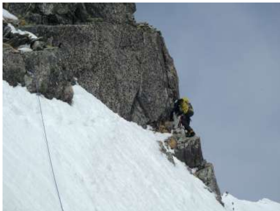
【 ジャンダルムを右からトラバース

ジャンダルム頂上から懸垂しようと思ったが、懸垂点も見つからなかったので一旦下降し、右からトラバースすることにした。ただし、夏道は左側。