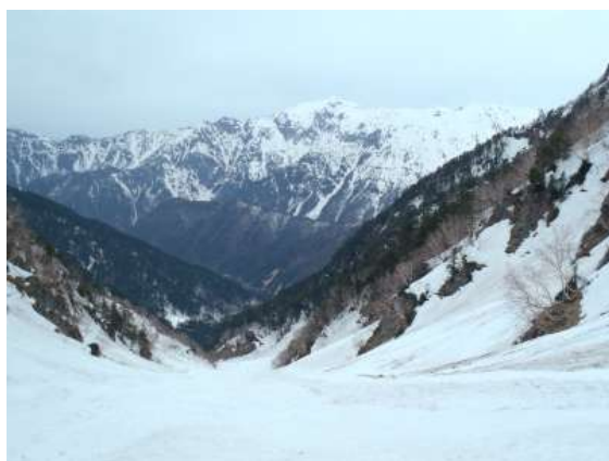
【 下山路の白出沢 】

白出沢はトレースがあるとのことだったが、雪が融けて歩きにくい。特に標高が下がるほどに酷くなる。私の膝が痛み出す。ゆっくり下りる。白出大滝の高巻きを超えた樹林帯の中で、