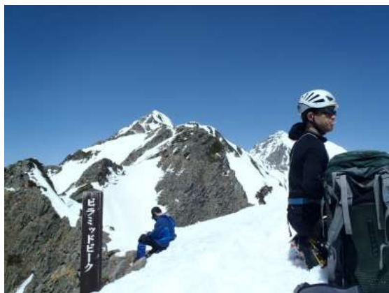
【 ピラミッドピーク 13：00】