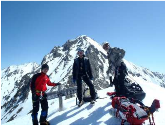
【 天部岳山頂 9 : 26 】