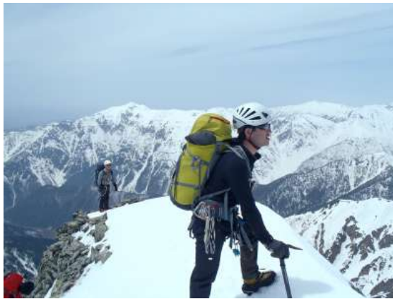
【 ジャンダルム頂上 12 : 22 】

ジャンダルム頂上から懸垂しようと思ったが、懸垂点も見つからなかったので一旦下降し、右からトラバースすることにした。ただし、夏道は左側。