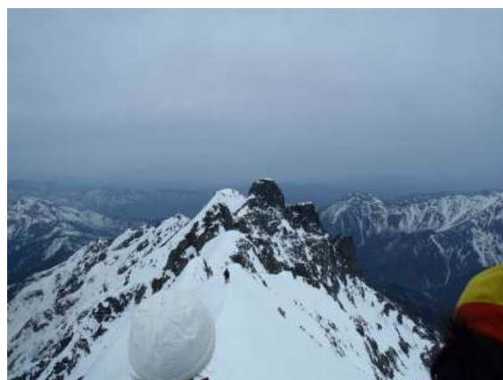
【 奥穂高岳山頂からのジャンダルム 】