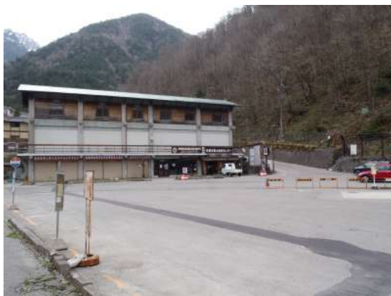
【 新穂高温泉バス停着 13:00 】

アイゼンに付いたダンゴを落としながら歩いていたら、ところどころバランスを崩し、樹林帯で5mほど滑落してしまった。やばかった。