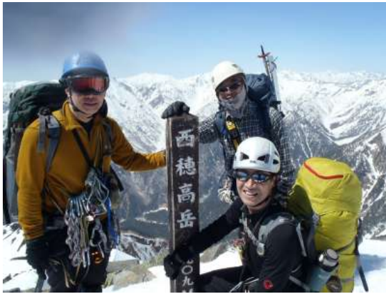
【 西穂高岳山頂 13:55 】

ここまではトレースがあったが、この先はトレースが見当たらない。雪も融けてきており、グシャグシャ、つぼ足ズッポリで歩きにくい。雪壁も割れてきておりクレバスになっている。随所でロープを使いながら下降する。