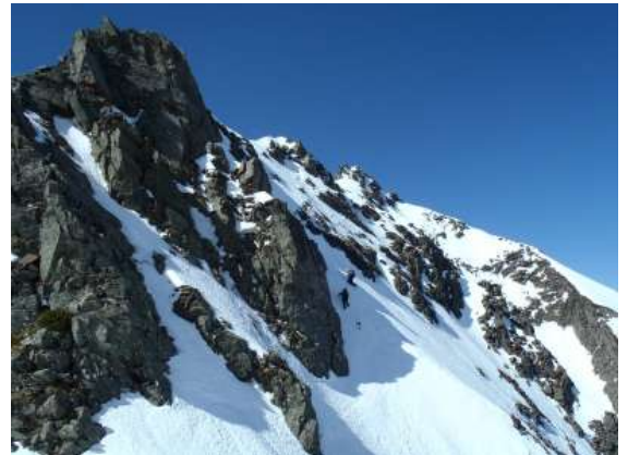
【 天狗の科尔手前の大雪壁を ダブルアックスで下る 】