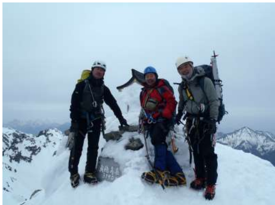
【 奥穂高岳山頂 7:00 】