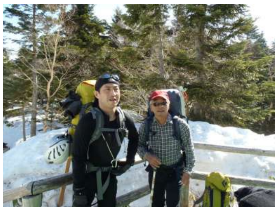
【 ロープウェイ頂上 8：45】

6：00起床。7：00駐車場発。新穂高ロープウェイで頂上駅まで行く予定。普段は8：30始発だが、連休とあって8：00運転開始に早まっていた。飛騨牛のステーキ串を皆で食べて景気づける。