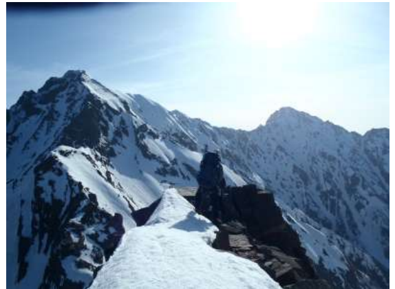
【 間ノ岳 6:58 】