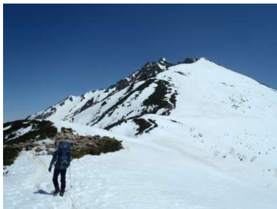
【 独標に向かう 】