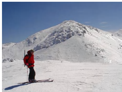
猫岳山頂からの四ツ岳