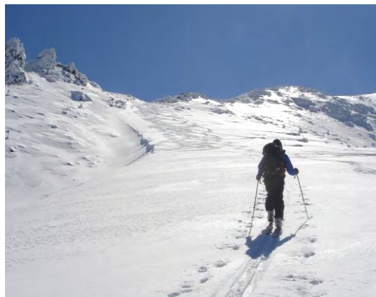
森林限界を越えて